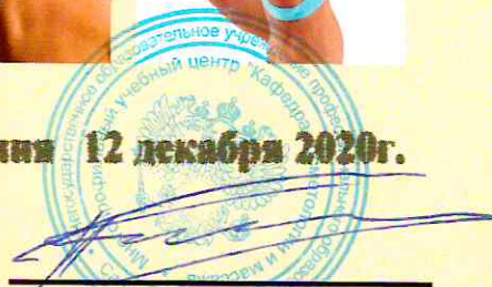
Коломнец Павел Преподаватель

Аккредитованный РАНМ центр Лицензия ЦП № 0039/ РФ-СА